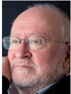
JESÚS VILLA ROJO Compositor